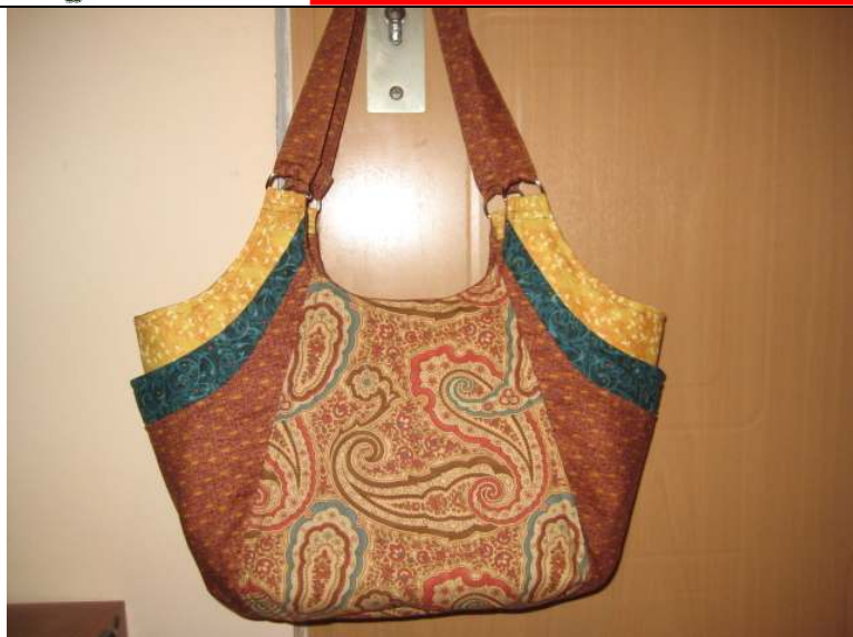
Taška 1 – hnedá verzia, autor: Anka Psotová