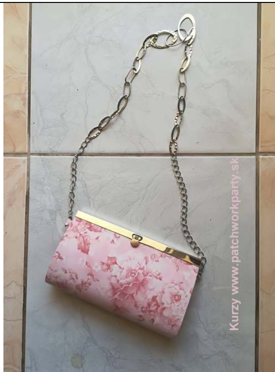
Kurzy www.patchworkparty.sk Listová kabelka k saku – autor: Anka Zimová