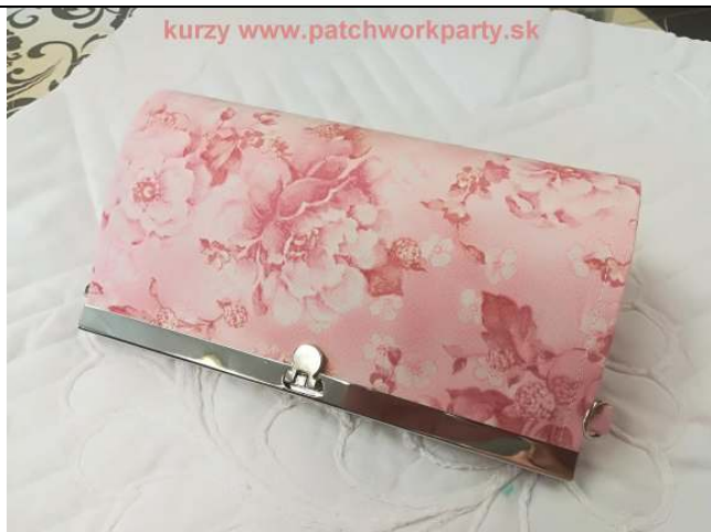
Listová kabelka - líce

TIP 5: Víkendové kurzy šitia a patchworku