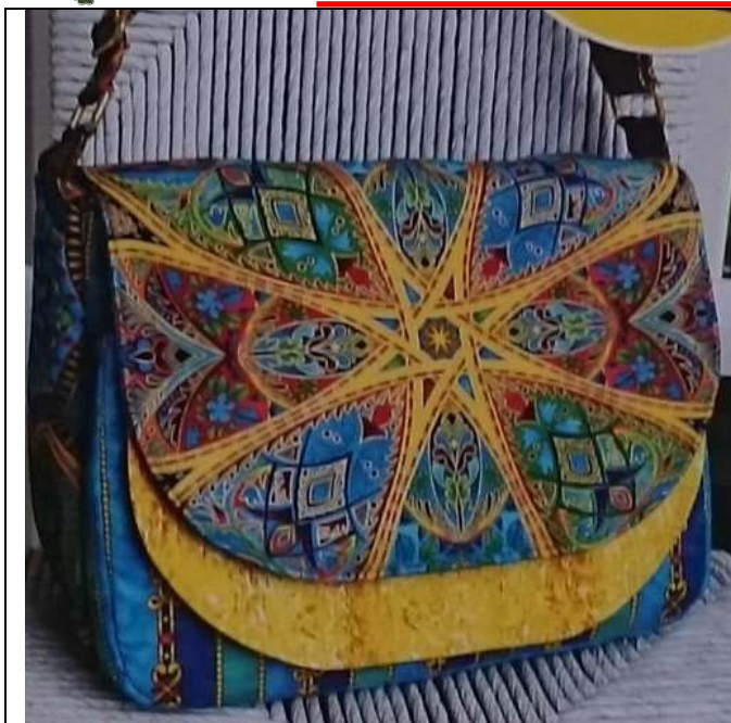
Taška 2 – lícová strana