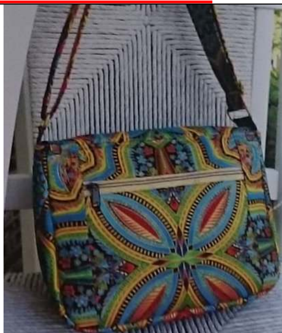
Taška 2 – rubová strana