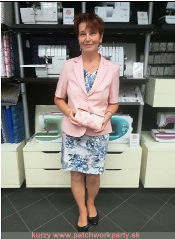
kurzy www.patchworkparty.sk Listová kabelka k saku – autor Anka Zimová