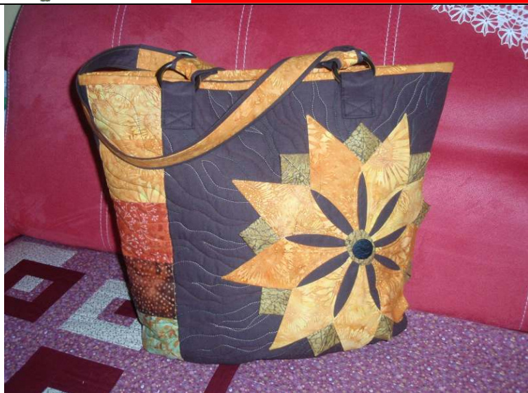
Taška 3, autor: Anka Psoťová