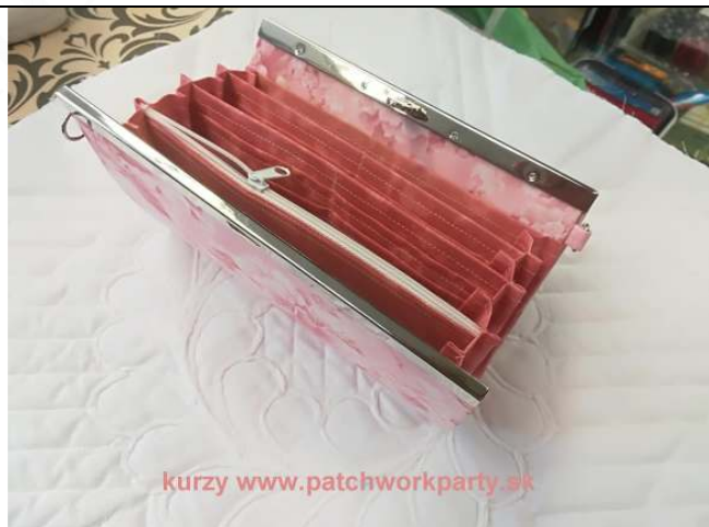
Vnútro listovej kabelky