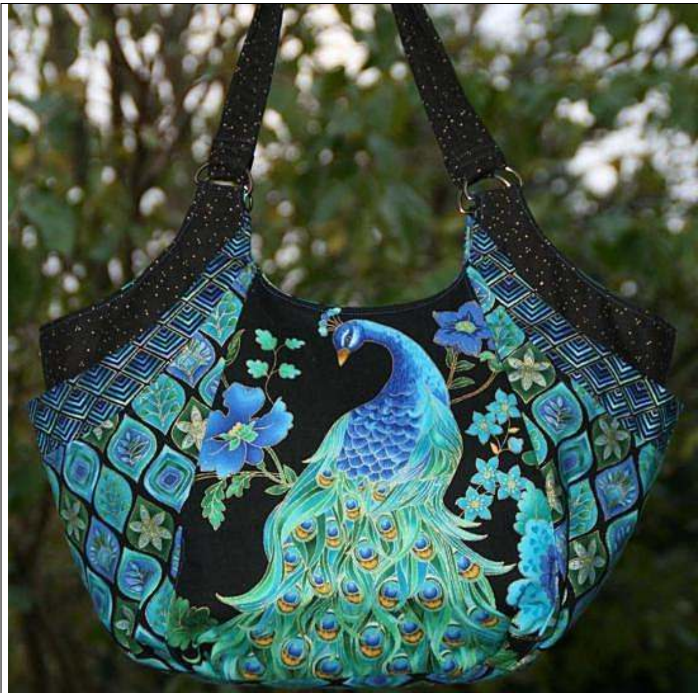
Taška 1 – verzia s pávom